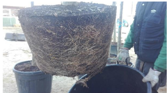
Comprobación de la calidad de la planta