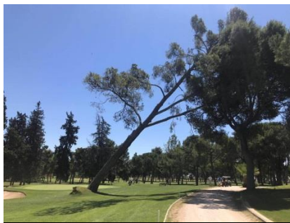
Ejemplares afectados con rotura radicular