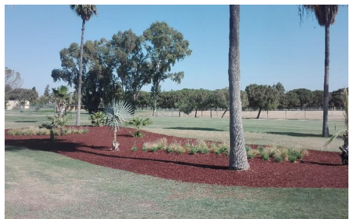
Mejoras realizadas en la zona Isla de Sombra I.