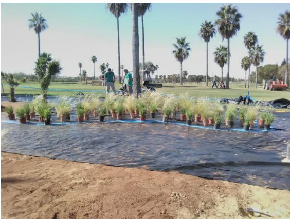
Durante las obras.