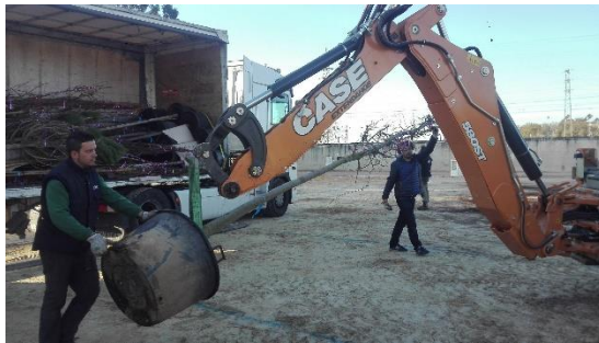
Descarga del material vegetal