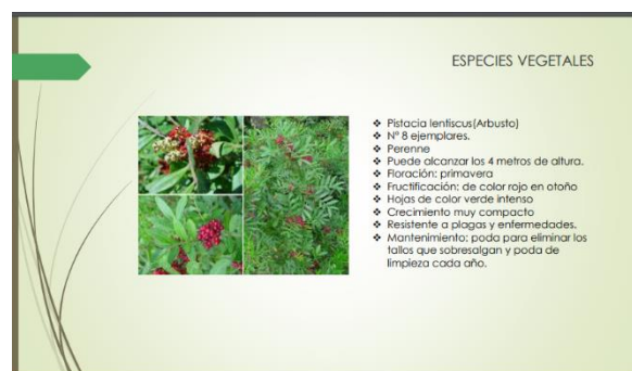
Propuesta para Isla de Sombra II