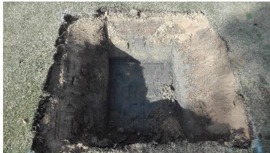
Hoyo de plantación